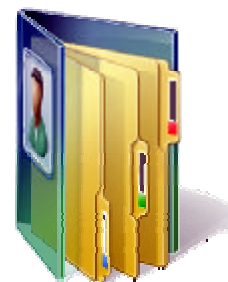
Lena (Eigene Dateien)

Zur Organisation aller Dateien werden Ordner angelegt, die wieder Ordner (Unterordner) enthalten können. In diesen Ordnern und Unterordnern werden die Dateien abgespeichert.